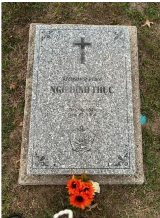
Miejsce ostatniego spoczynku arcybiskupa Thuca w Carthage, Missouri

W 1870 roku Sobór Watykański I pod przewodnictwem papieża Piusa IX, dobitnie nauczał: