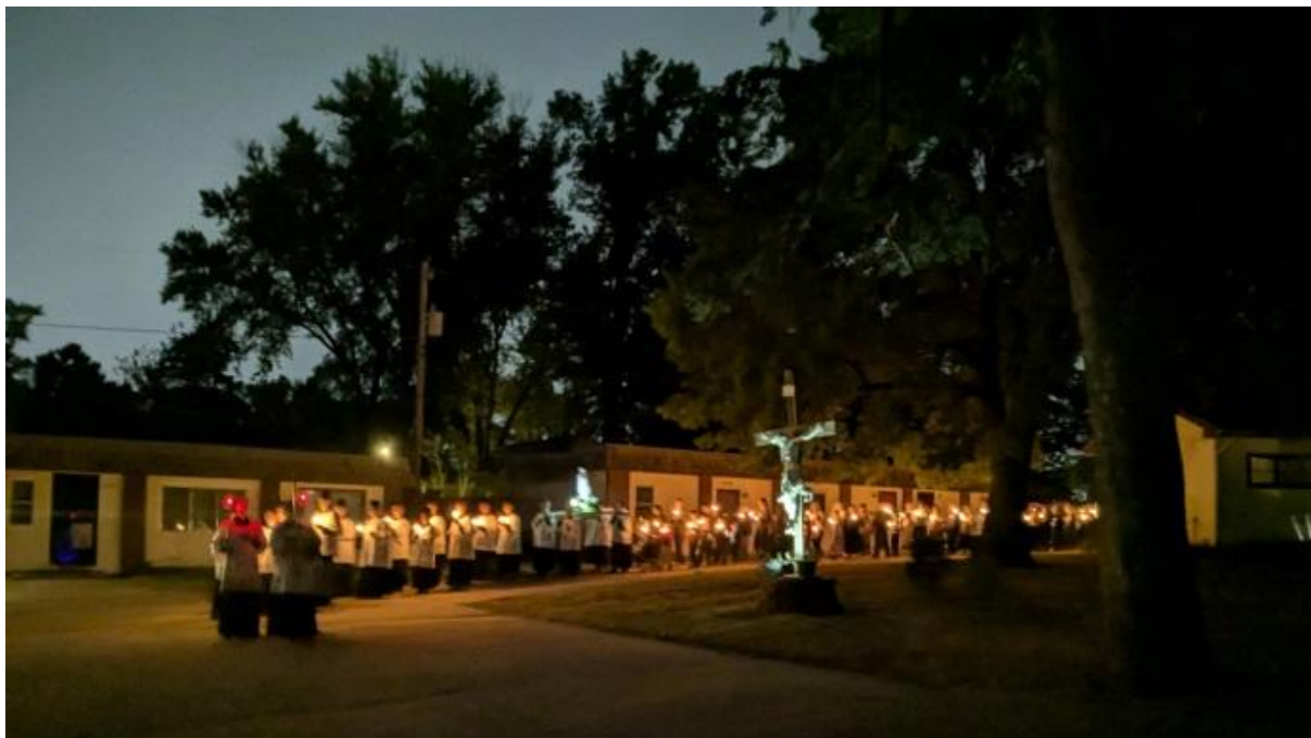
Procesja różańcowa przy świecach w święto Najświętszego Różańca