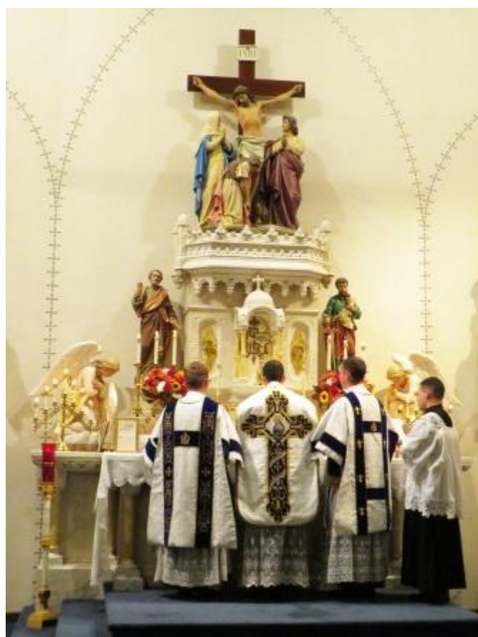
Uroczysta Msza św. w święto Bożego Macierzyństwa – święto tytularne seminarium