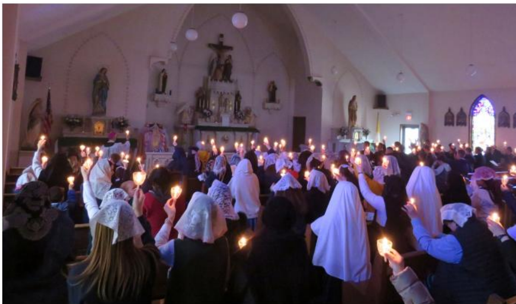
Candlelight Rosary in honor of Our Lady of Lourdes