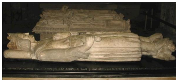
Charles I of Naples (or Anjou), Basilica of Saint Denis. Note he holds his heart in his left hand. All but three of the kings of France are buried in this ancient church.