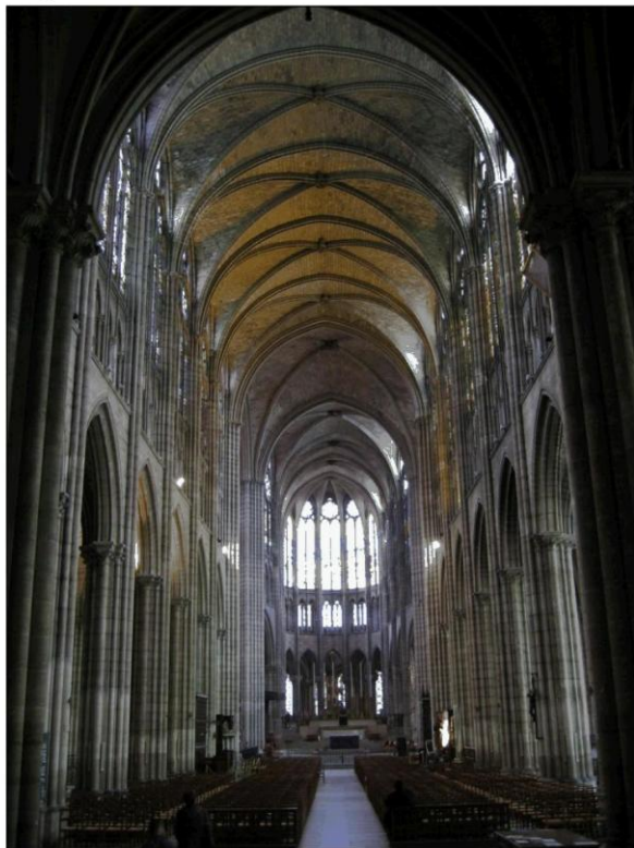
Basilica of Saint Denis in Paris, France