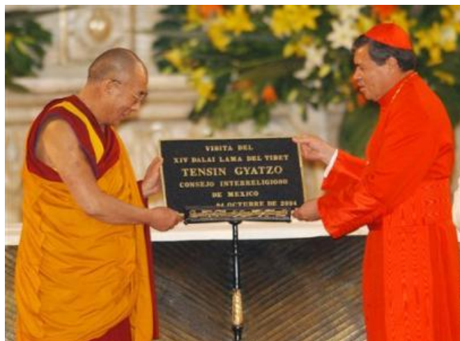
Dalajlama razem z "arcybiskupem" Meksyku, "kardynałem" Norberto Rivera w Katedrze Metropolitalnej w Meksyku (8 X 2004)

Tak, tradycyjni rzymscy katolicy są niezwykle zszokowani takimi wydarzeniami, natomiast moderniści nie przejmują się w ogóle. Coraz bardziej oczywistym i wyraźnym staje się fakt, że moderniści, okupujący na całym świecie te niegdyś katolickie kościoły, nie wyznają prawdziwej rzymskokatolickiej Wiary. Zwracam się do Was z prośbą, poświęćcie trochę czasu by powiedzieć innym o tych bezceństwach, aby w ten sposób przekonać ich do tego by odseparowali się od takich bluźnierczych działań. Połączmy się wszyscy razem w modlitwie i ofierze, by zadośćuczynić za te zbrodnie i wyprosić łaskę zwycięstwa nad wrogami Boga i Jego Kościoła.