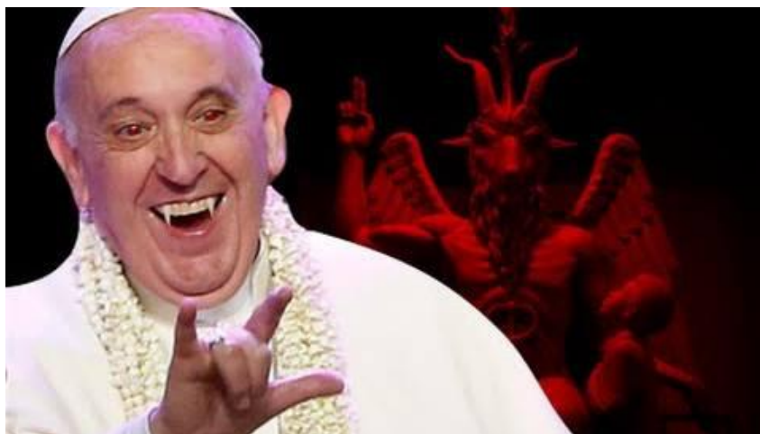
Fotomontaż autorstwa "indultowych antybergolian"

U progu Nowego Roku, wskazane jest spojrzeć na wydarzenia minionego 2014 roku, które były istotne dla Kościoła katolickiego. Sądzę, że wśród wielu zdarzeń o jakich można by tu wspomnieć niezwykle alarmującym był "Synod o rodzinie". Pod szyldem hierarchii katolickiej, soborowi "kardynałowie" i "biskupi" debatowali nad tym czy przy rozstrzygnięciu nad dopuszczeniem do Komunii par żyjących w cudzołóstwie oraz deliberacjach nad pozytywnymi aspektami sodomskich związków we wspólnocie chrześcijańskiej mają zastosowanie VI i IX Przykazania Boże. Zarówno słowa jak i czyny "Franciszka I" wyraźnie wskazywały, że opowiada się za przyjęciem zmian nauczania Kościoła katolickiego w tych dziedzinach.