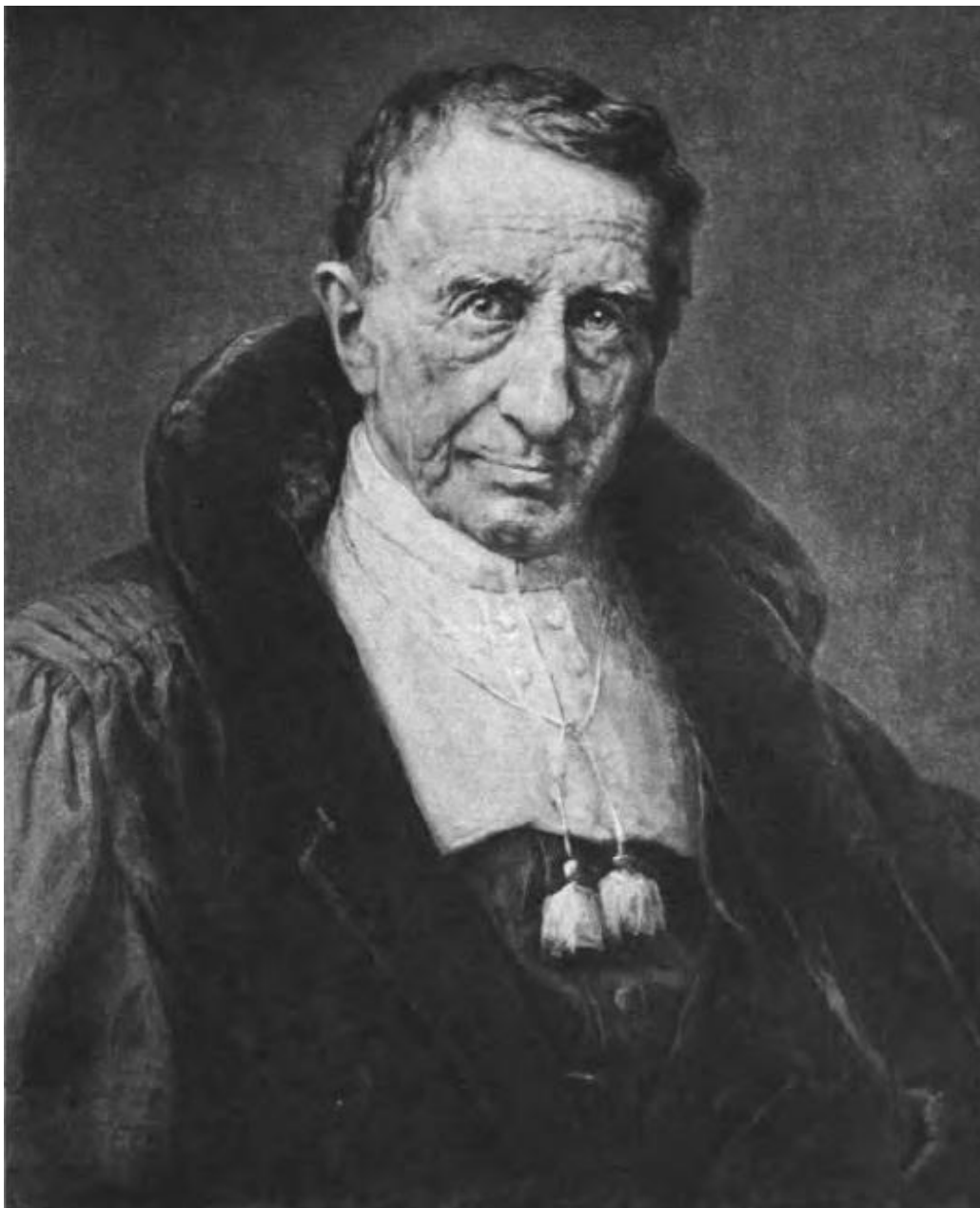
Apostata Ignaz von Döllinger