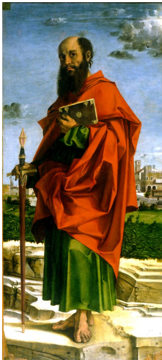
ŚW. PAWEŁ APOSTOŁ NARODÓW