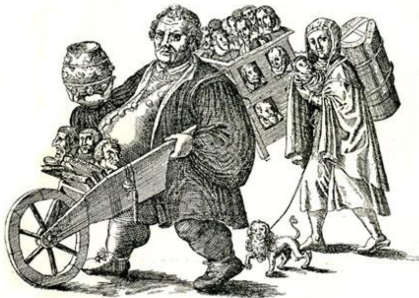
Caricatura di Lutero e Caterina Bora.

Originale nella Biblioteca Pubblica di Berlino.