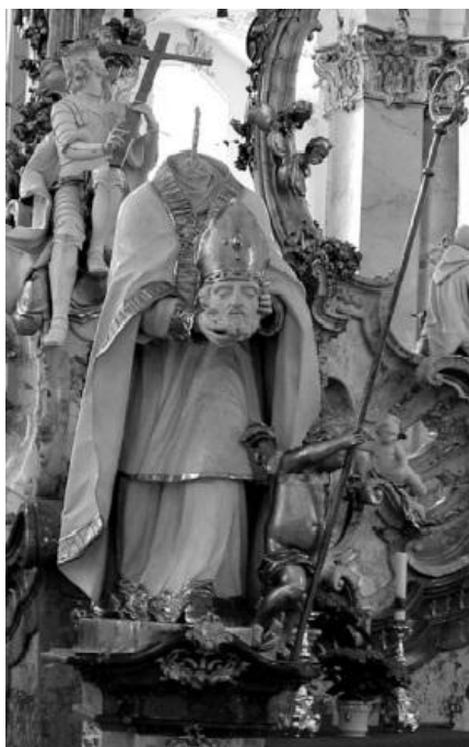
Ta piękna figura św. Dionizego zdobi Bazylikę Czternastu Orędowników w Bawarii w Niemczech

Historyczne źródła podają również, że gdy Dionizy Areopagita dowiedział się, iż Matka Boża mieszka w Jerozolimie, wybrał się w drogę, by tam Ją spotkać. Po czym stwierdził: "Jej wygląd, Jej rysy, Jej cały wygląd świadczą o tym, że jest rzeczywiście Matką Boga". Napisał też, że gdyby nie otrzymał przeciwnych nauk od św. Pawła, to wziąłby Ją za boską istotę. Św. Dionizy jest wzywany przeciwko diabelskim opętaniom i bólom głowy.