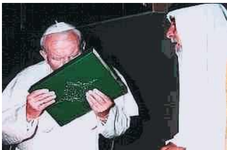
Osculator Alcoranis (2)

do osoby i nauczania Jezusa z Nazaretu... nigdy nie może być przedmiotem zewnętrznego nacisku z jednej czy z drugiej strony". Albo, kiedy 14 maja 1999 roku przyjął na audiencji muzułmańską delegację szyickich i sunnickich przywódców. Na koniec wizyty, skłonił głowę przed trzymanym przez muzułmanów Koranem, wziął go do rąk i pocałował "na znak szacunku".