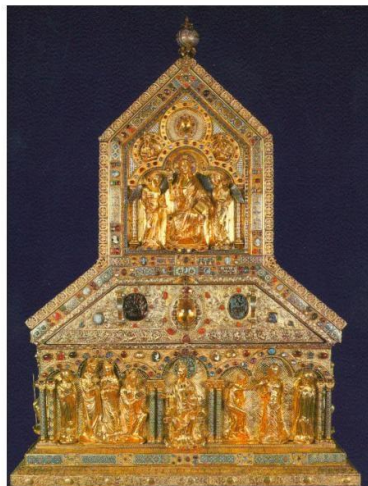
The Relics of the Three Magi

There can be no doubt that they encountered many inconveniences on their journey, but the greatest difficulty,