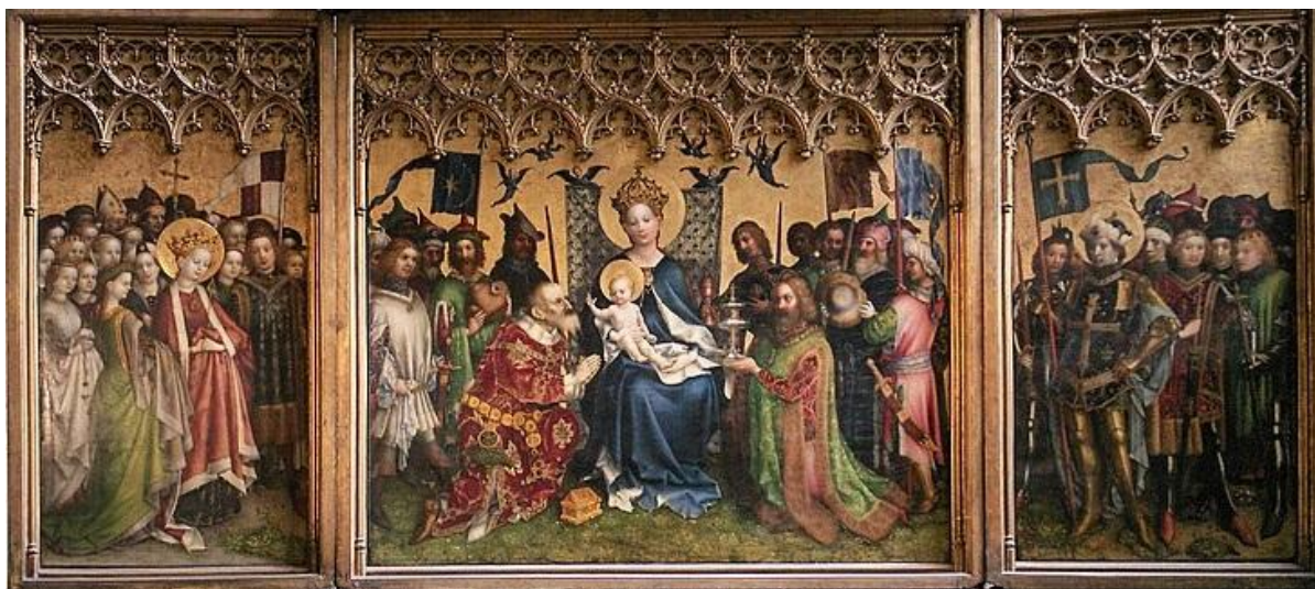
Ołtarz Trzech Króli (ok. 1440) w katedrze św. Piotra i Najświętszej Maryi Panny w Kolonii