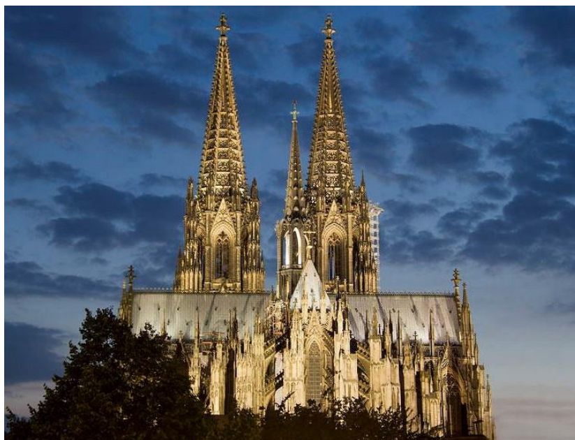
Katedra w Kolonii